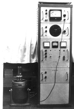
Рис. 1. Вибрационный стенд ВЭДС-10А Fig. 1. Vibration stand VEDS-10A

Среди разнообразных технологических способов и приемов получения пористых материалов с заданным распределением пор можно выделить метод виброформования, заключающийся в наложении вибрационных колебаний на форму с порошком [6]. Получить необходимое распределение пор таким методом можно при грамотном выборе размеров частиц, их формы, а также параметров вибрационных колебаний. Это позволит достичь необходимой укладки частиц по размерам (плотности укладки), размера пор, извилистости и длины поровых каналов. Исследования влияния вибрационных колебаний на распределение размеров пор по толщине образца проводились с применением вибрационного стенда ВЭДС 10-А, представленного на рис. 1 [7].