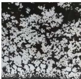
Рис. 4. Фотография шлифа капиллярной структуры тепловой трубы, полученной методом вибрационного формования