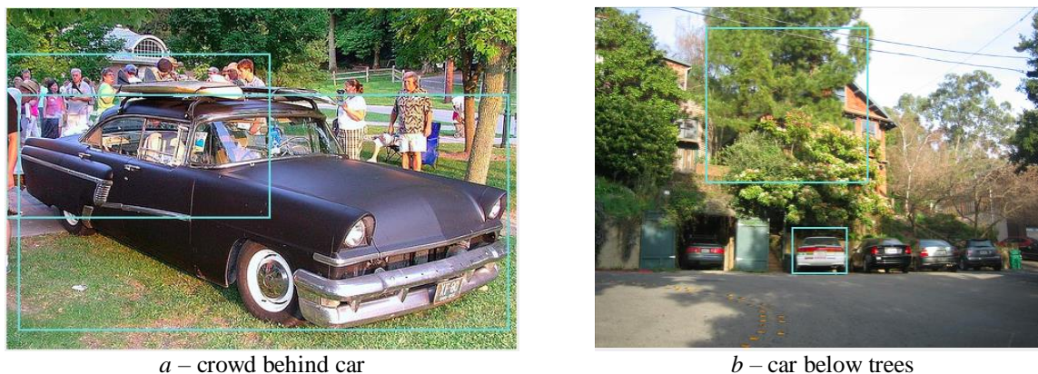
Рис. 3. Примеры регионов из экспериментальной выборки с соответствующими аннотациями регионов Fig. 3. Examples of regions from the experimental sample with corresponding captions

Первый набор представляет собой выборку из изображений, в которой на каждое из рассматриваемых отношений приходится по 50 регионов с привязкой (т. е. 50 регионов с отношением «above», 50 регионов – с «below» и т. д. – всего 350 регионов). Примеры таких изображений приведены на рис. 3.