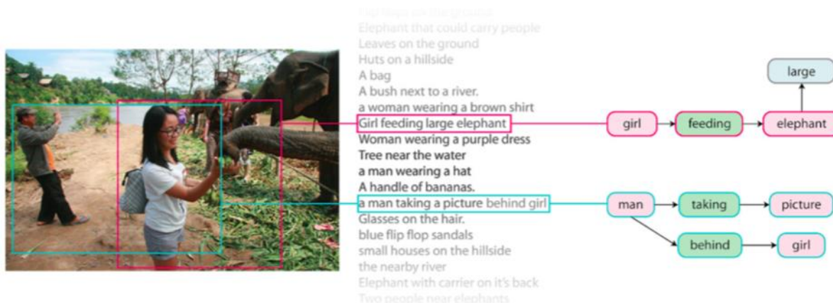
Рис. 1. Пример изображения из Visual Genome с привязкой [9] Fig. 1. An example of an image from Visual Genome with grounding [9]

Пример привязки сцен-графа к регионам на изображении из Visual Genome приведен на рис. 1.