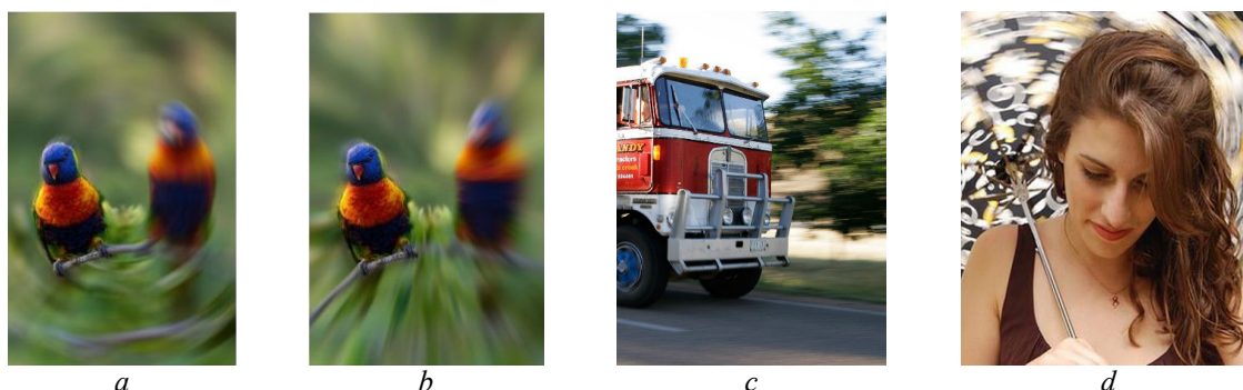
Рис. 2. Примеры искусственно созданного размытия на изображениях: a – радиальное размытие; b – масштабирование; c, d – примеры изображений с естественным размытием (из-за движения) Fig. 2. Examples of artificially blurred images: a – radial blur; b – the zoom blur; c, d – motion blur