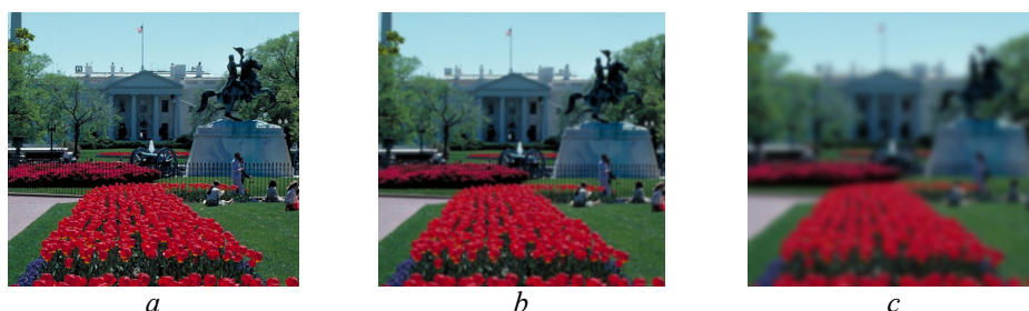
Рис. 1. Примеры изображений базы CSIQ [1]: a – исходное изображение; b, c – изображения после применения фильтра Гаусса с разными параметрами Fig. 1. Examples from the CSIQ image database [1]: a – an original image; b, c – images after applying the Gaussian filter with different parameters