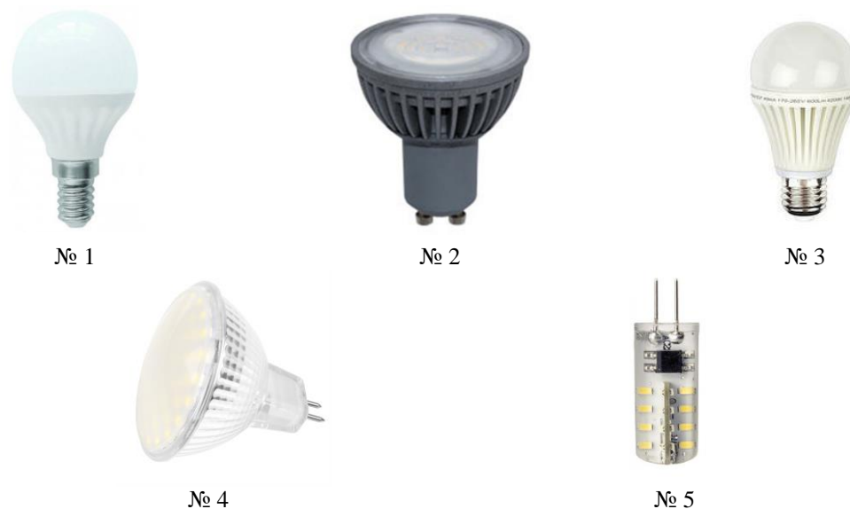
Рис. 1. Внешний вид исследуемых светодиодных ламп различной конструкции Fig. 1. The appearance of the investigated LED lamps of various designs